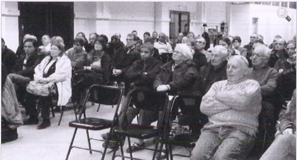
Le public lors de la soirée de concertation concernant la ZAC du Rivel.

Les questions ont fusé lors de la réunion de concertation du projet de la zone d'aménagement concertée du Rivel et les acteurs du projet étaient présents à La Coopé pour répondre aux interrogations du public le mercredi 11 février à Baziège, salle de la Coopé.